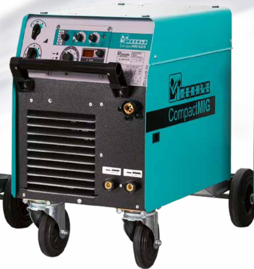
CompactMIG 400 K