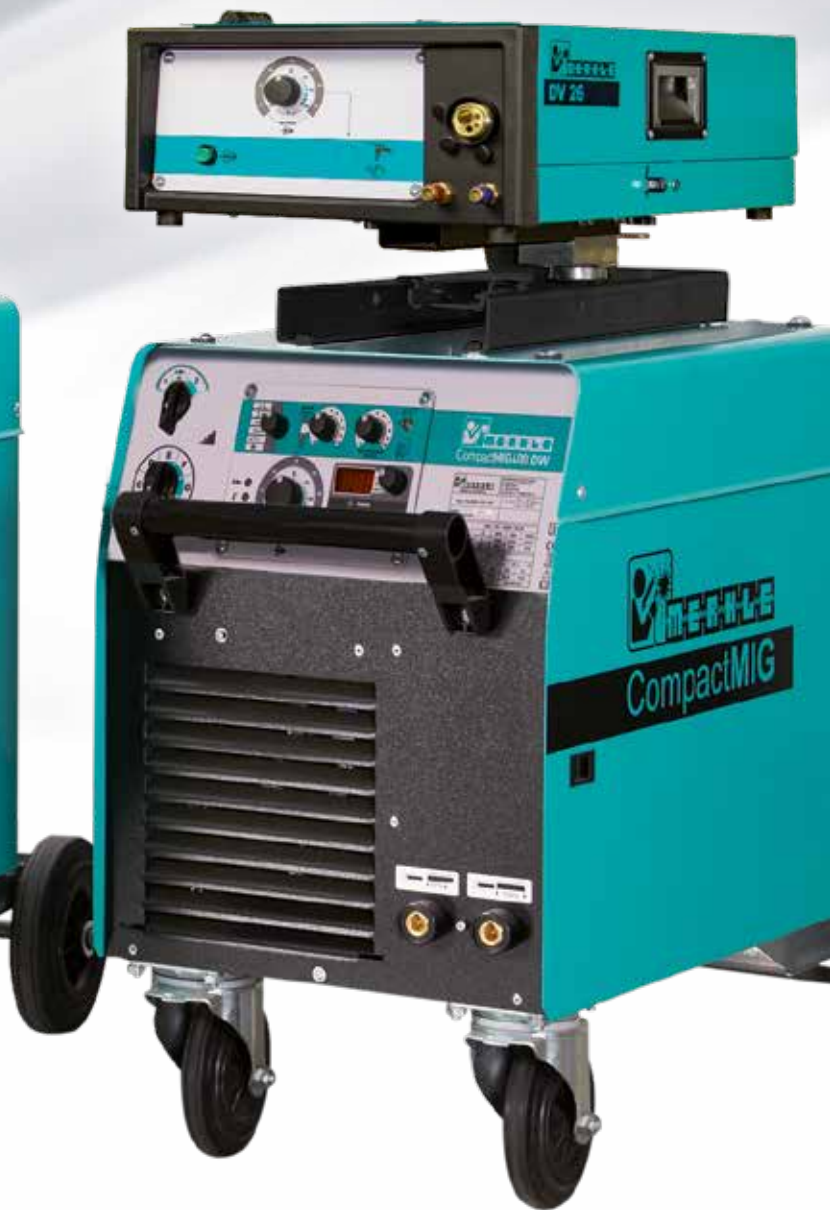
CompactMIG 400 DW