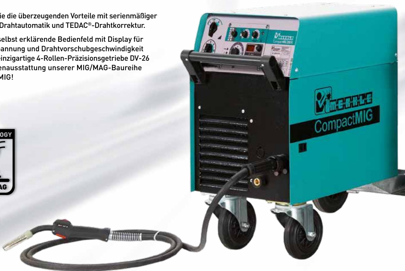
CompactMIG 280 K