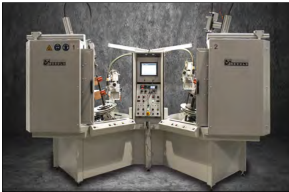
Doppel-Rundnaht-Schweißautomat mit zwei Drehtischen und zentraler Steuerung.