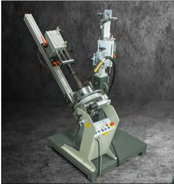
Drehtisch D302/60 auf Sockel mit 3-Backen-Futter, pneumatischer Brennerzustellung und Gegendruckpinole.