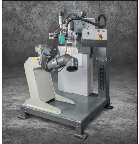
Drehtisch D302/60 auf Sockel mit automatischer Schweißnahterkennung durch Laserabtastung.