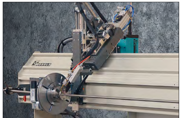
Rundnaht-Schweißanlage zum Schweißen von Rohr-Flansch-Verbindungen.

Wir senden Ihnen diesen Newsletter, da wir davon ausgehen, dass die Inhalte für Sie als Schweißfachbetrieb interessant sein könnten. Wenn Sie künftig keine E-Mails von uns erhalten möchten, dann senden Sie uns bitte eine E-Mail mit dem Betreff „abmelden“.