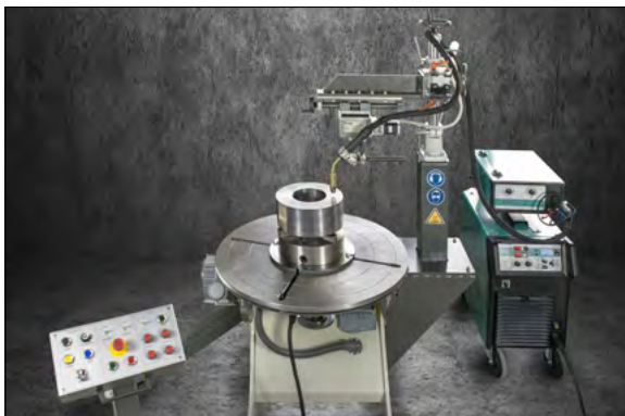
Drehtisch D1003 mit 3-Backen-Spannfutter und Linearpendelgerät zum Auftragschweißen.