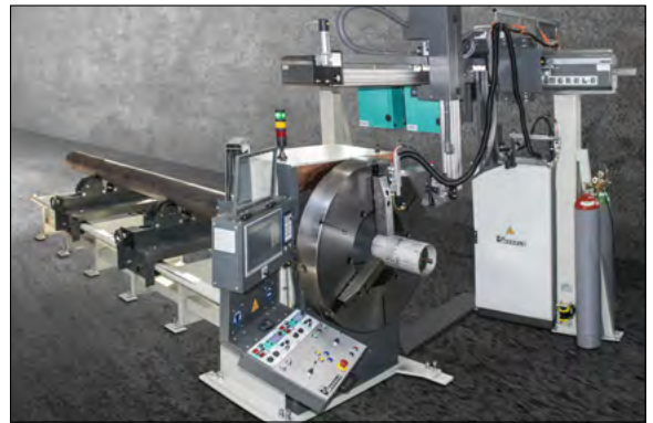
Rundnaht-Schweißanlage für lange Rohre mit einem Durchmesser von 150 bis 500 mm.